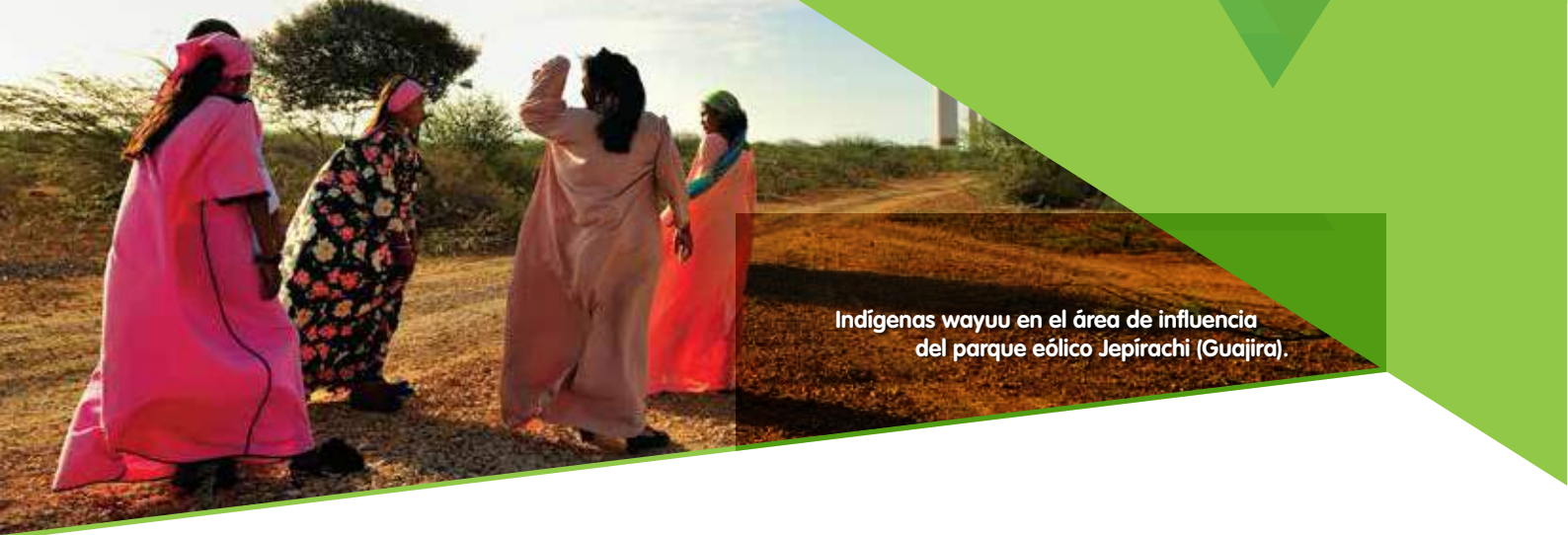
Indígenas wayuu en el área de influencia del parque eólico Jepirachi (Guajira).